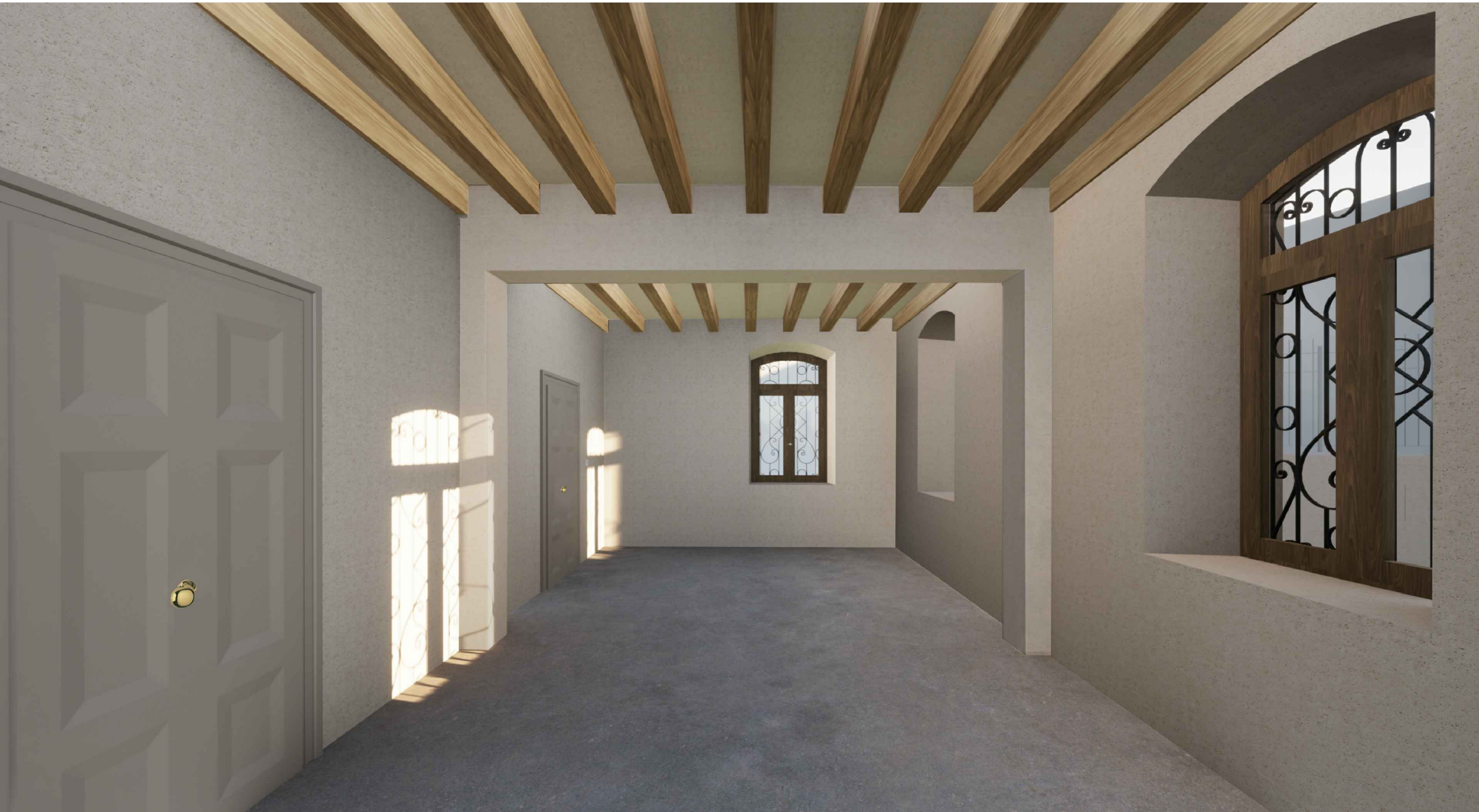
Vista interna - Stanza Piano Terra