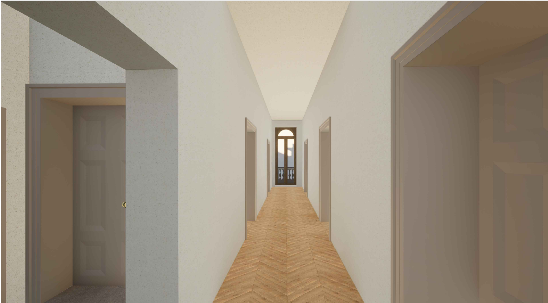
Vista interna - Corridoio Piano Primo